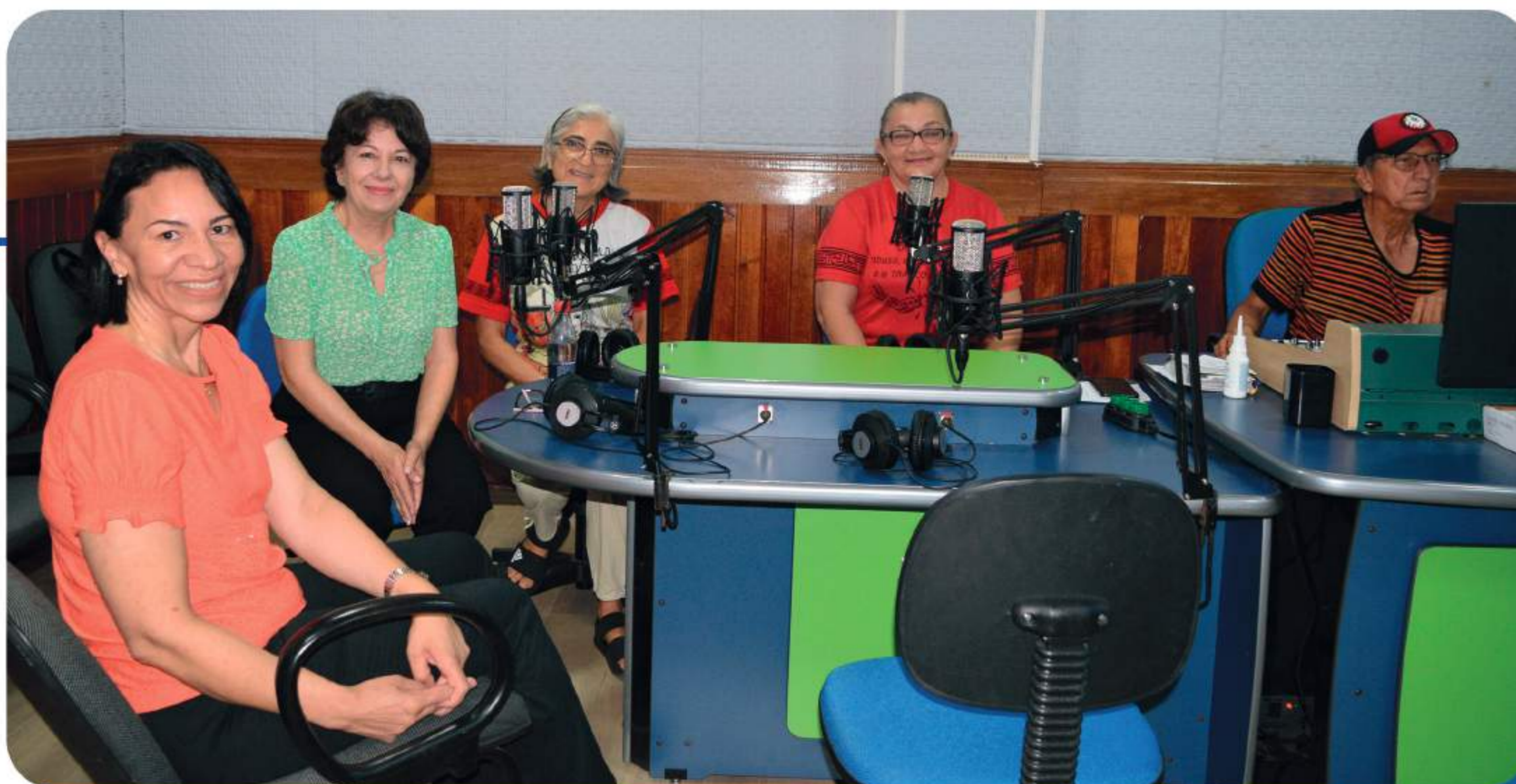
Entrevista na Rádio Educação Rural de Tefé (AM).