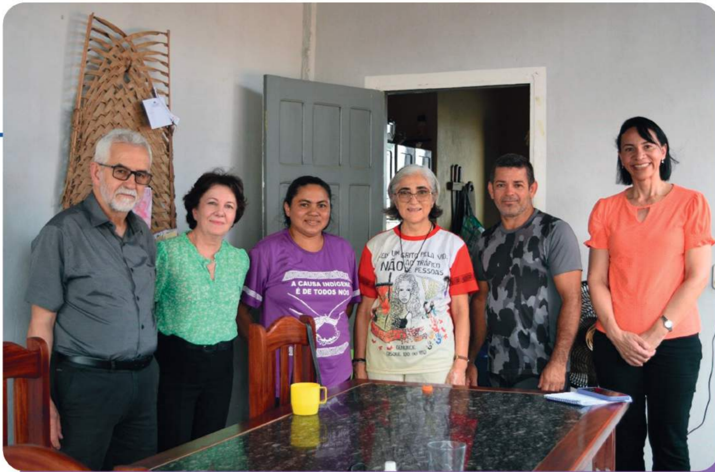
Encontro com os representantes do Conselho Indigenista e Missionário (CIMI) – Prelazia de Tefé (AM).